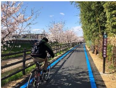
整備された京奈和自転車道の利用状況